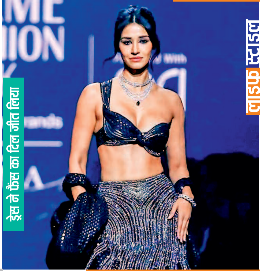
इस ने फैंस का दिल जीत लिया

मुंबई फैशन वीक में एक्ट्रेस दिशा पाटनी ने डिजाइनर अमित अग्रवाल की बनाई ब्लैक गाउन ड्रेस पहनकर रैप वॉक की। साथ ही हीरे और पन्नों वाली ज्वेलरी भी पहनी थी। हेयरस्टाइल के तौर पर जूड़ा बनाया हुआ था, इसमें से कुछ लट्टें खुली हुई थीं। उसके इस लुक और ड्रेस ने फैंस का दिल जीत लिया।